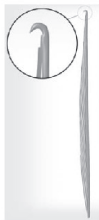
68) כוח :

[משנ"ב ס"ק לו] ש"עקום ו'נכפף ל'צד הש'נה'.